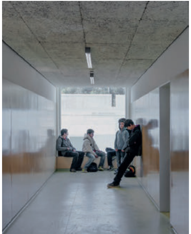
Densificar el conjunto, atribuir complejidad a la relación entre las partes; construir entre los pabellones espacios destinados a las actividades colectivas de la escuela.