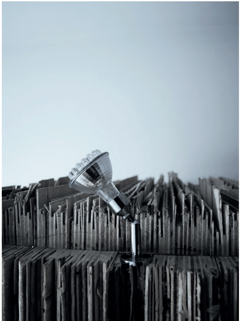
Los restos de triplex que generó la fabrica con el corte del material se utilizaron en contenedores, aportando su textura.