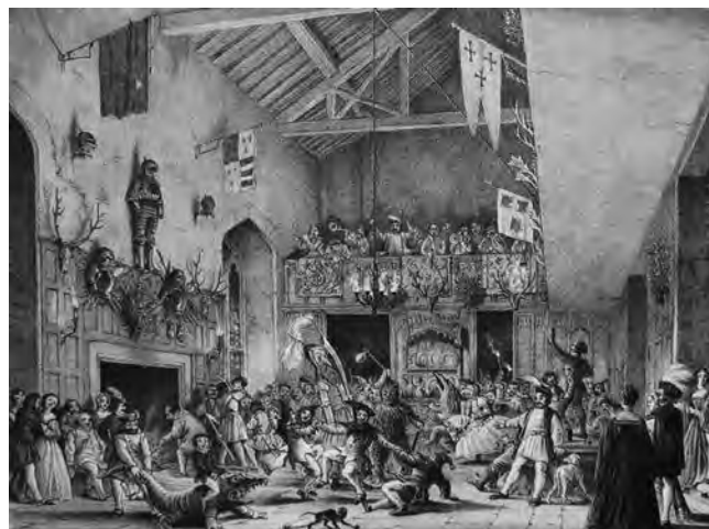
[4] Haddon Hall, 1300-1330. (Vista hacia el screen y la galería de los músicos). Dibujo de Joseph Nash, 1838. Twelfth Night Revels in the Great Hall, Haddon Hall, Derbyshire. Del libro de Joseph Nash; Architecture of the Middle Ages, 1838. También reproducido en el librote de Joseph Nash; The Mansions of England in the Olden Time, 1906, Lámina XXV.

A principios del siglo XIV los muros del hall se construyeron de piedra y se abrieron en ellos grandes ventanales apuntados, por lo cual el este espacio comenzó a parecerse a la nave de una iglesia. 19 [4] La mesa del señor, situada sobre el dais (una tarima ligeramente elevada al fondo del hall ), era compartida por su principal invitado y, en ocasiones, por el administrador de la casa. El resto de los invitados ocupaban dos largas mesas paralelas al eje, de manera que podían disfrutar de un doble espectáculo: hacia un lado, el espectáculo del señor y sus principales invitados sobre el dais , hacia el otro, el espectáculo del screen y la balconada de los músicos. En el momento en que la procesión de sirvientes atravesaba el screen y hacia su aparición en el hall portando las bandejas con la comida, los músicos, situados en la balconada situada sobre el screen passage , comenzaban a tocar. 20