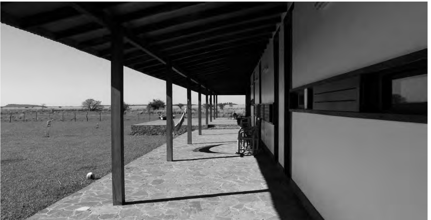
Arriba, pabellón principal. Derecha, habitación de invitados, pabellón principal.