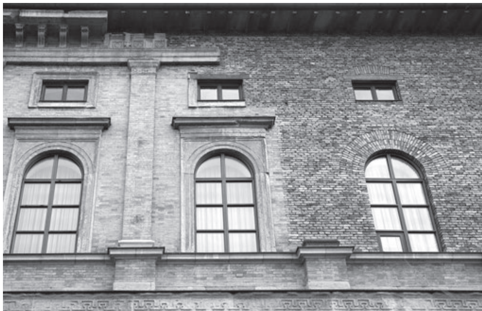
[6] Detalle de la consolidación de los restos de la envolvente de Klenze por Döllgast completando sillares dañados con fábrica de ladrillo y adosado de otros restos de la fábrica antigua a la nueva fábrica de Döllgast. Autor: Elena Zapatero Rodríguez.