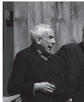
[1] Kenneth Frampton. http://www.architecturenorway.no/stories/people-stories/framptonpallasmaa-11/ (Consulta 13 de diciembre de 2015).