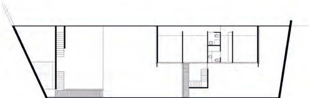
0 1 5 PLANTA PRIMERA DE LA NUEVA INTERVENCIÓN