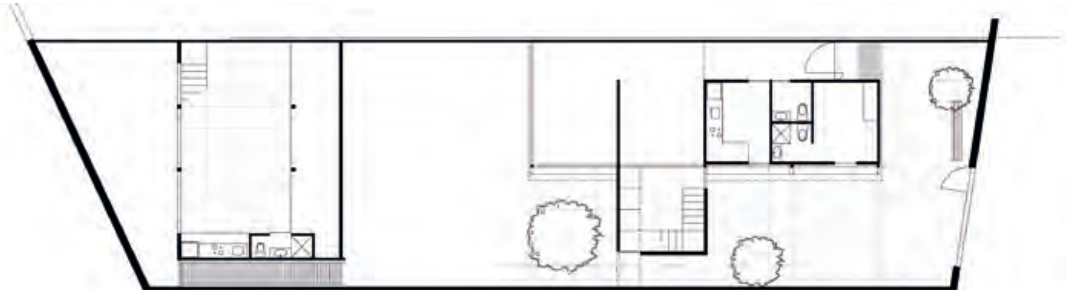
0 1 5 PLANTA BAJA DE LA NUEVA INTERVENCIÓN