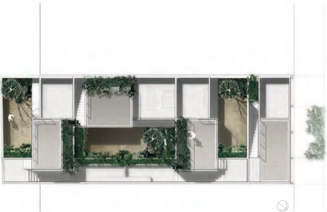
0 1 3 5m PLANTA GENERAL