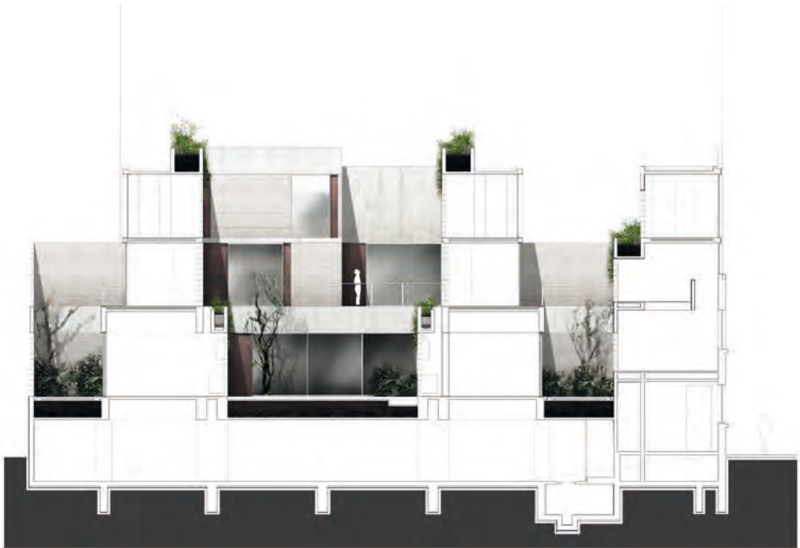
0 1 3 5m SECCIÓN LONGITUDINAL