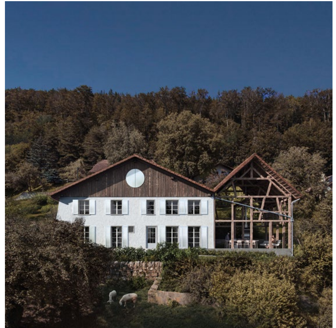
figura 9 Maison Chevre (c) KOSMOS

P.R.B. Creo que están muy abiertos a considerar muchas cosas a su alrededor, esa actitud ha comenzado a crecer, de estar al tanto de lo que sucede. Avanzar y cambiar de dirección cuando se