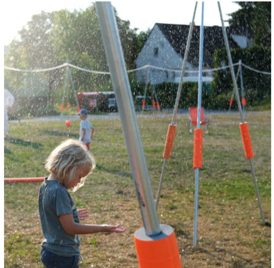
figura 11 3 Urban Rain Graz (c) KOSMOS

Universidad Andrés Bello. Arquitecto de la Universidad de Chile con estudios de Magister en la Pontificia Universidad Católica de Chile. Docente en la Universidad Andrés Bello, Universidad de Chile y Universidad Mayor. Se desempeña en el área de Historia y Teoría, Construcción, Representación y Taller. Su práctica se ha concentrado en el desarrollo de concursos públicos donde ha sido premiado nacional e internacionalmente. Es fundador y editor general de la editorial independiente PRIMAPress cuyo trabajo está dedicado a la difusión y promoción de oficinas jóvenes en Chile. parojas@gmail.com