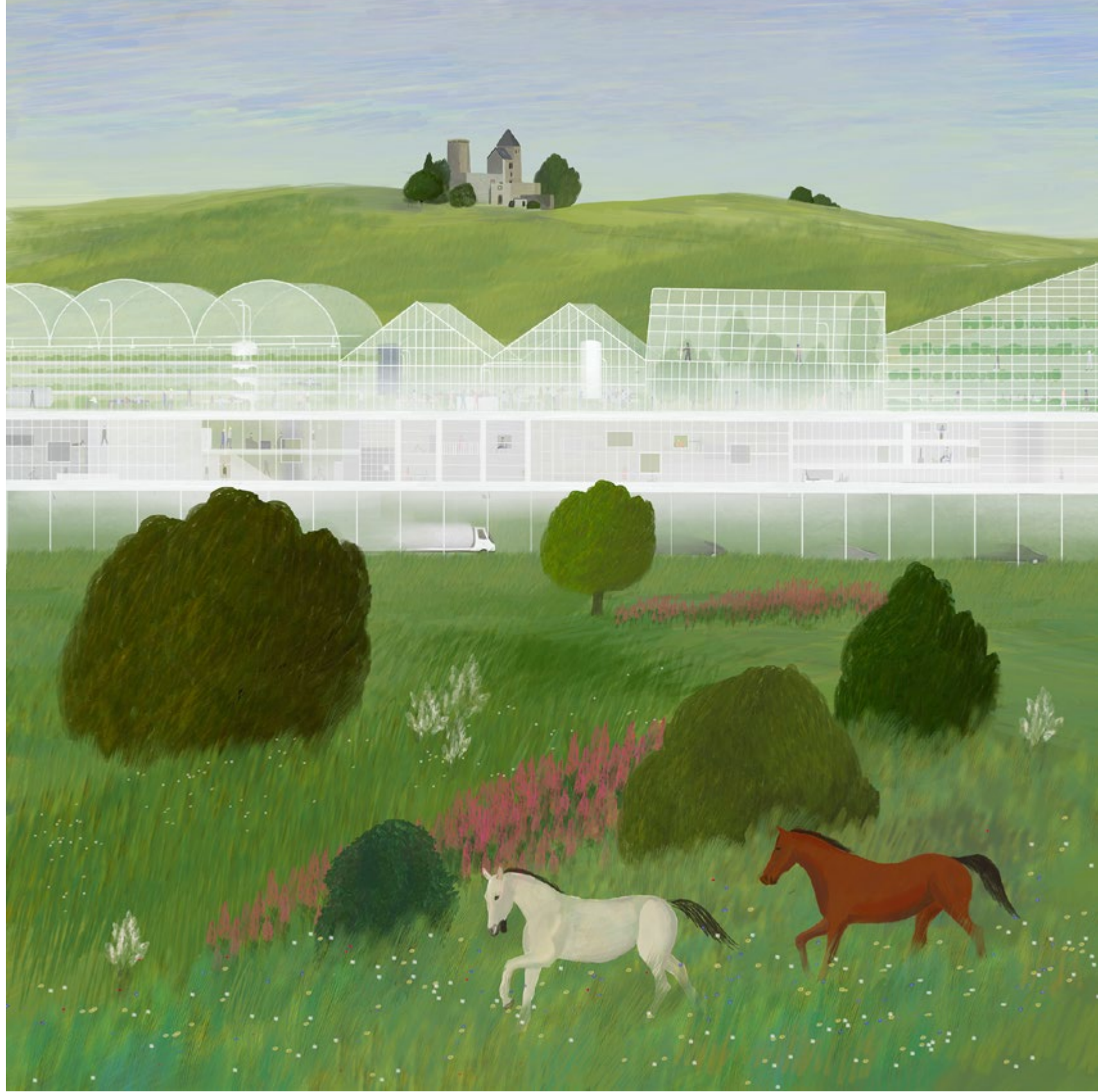
figura 7 Polish Pavilion Venice biennale