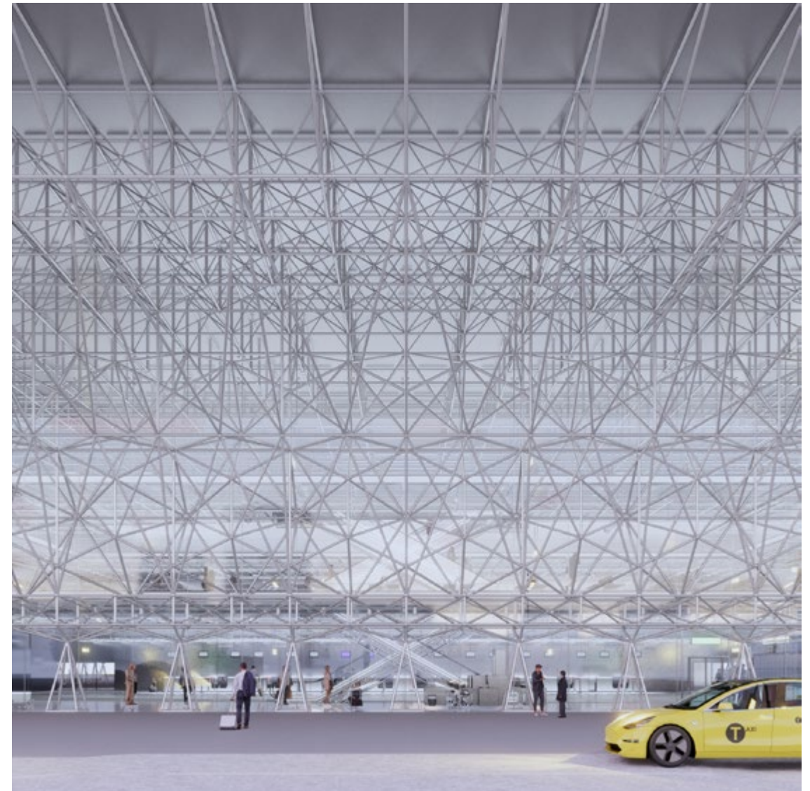
figura 3 Andersen Museum 1st prize (c) KOSMOS. (pag 102 -103)

Los proyectos de los estudiantes o proyectos especulativos son un poco más abstractos y muchas de las limitaciones existentes como