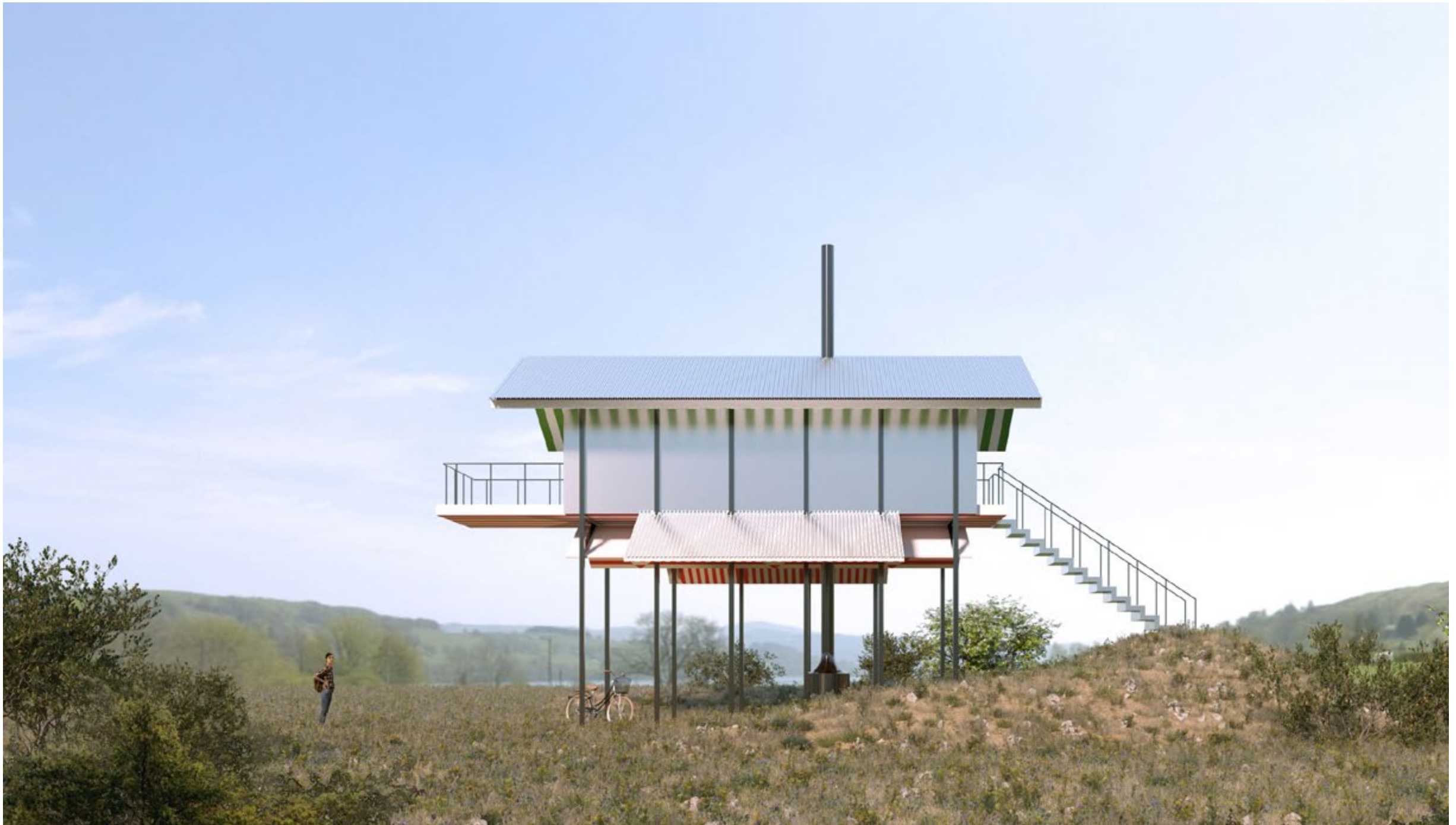
figura 8 Chateau Chapiteau Nomadic House (c) KOSMOS