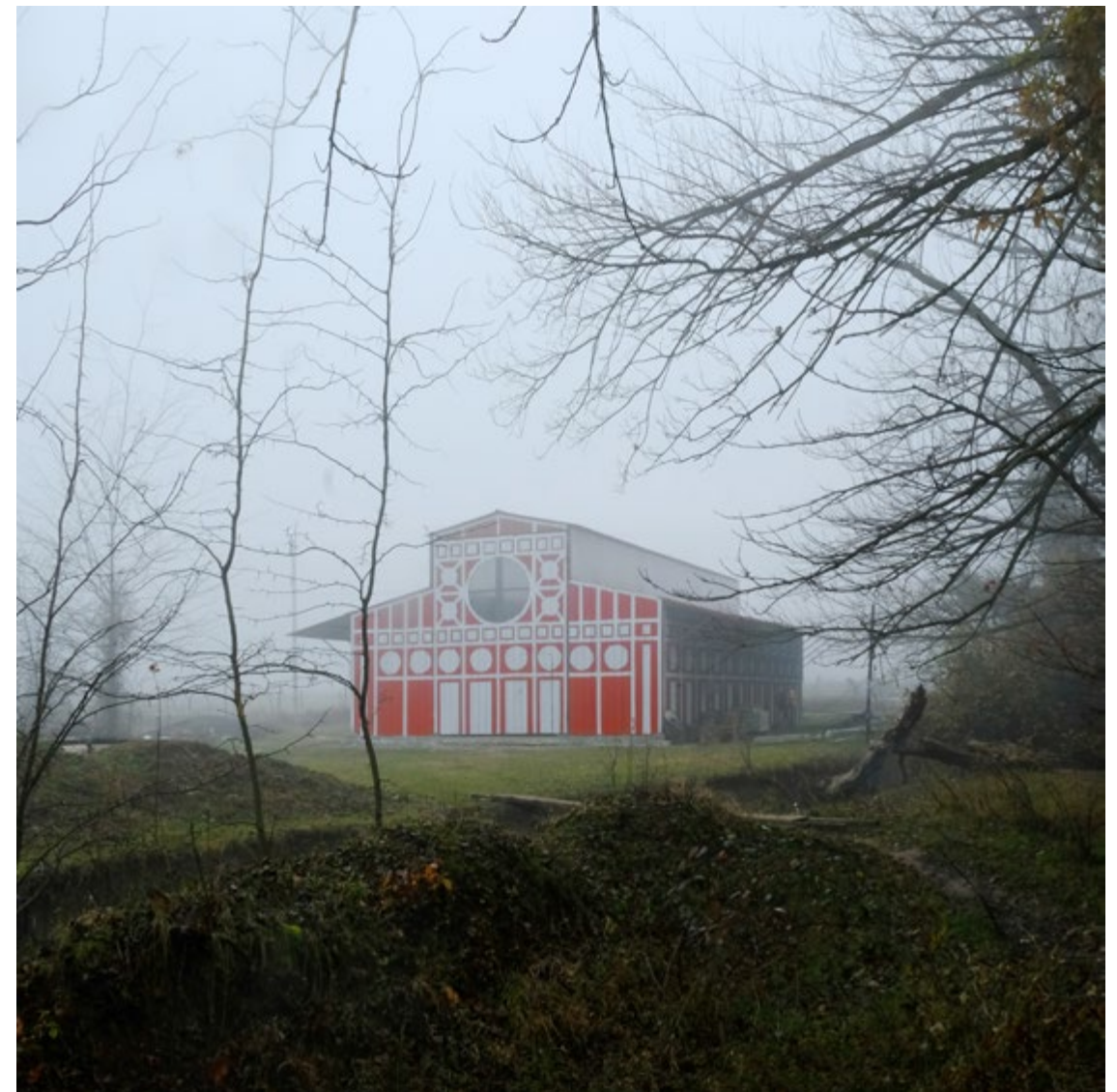
figura 10 Chateau Chapiteau Barn (c) KOSMOS

P.R.B. Esta idea de ser extranjero creo que está muy presente en su práctica, ustedes viajan mucho y absorben muchas cosas de diferentes países.