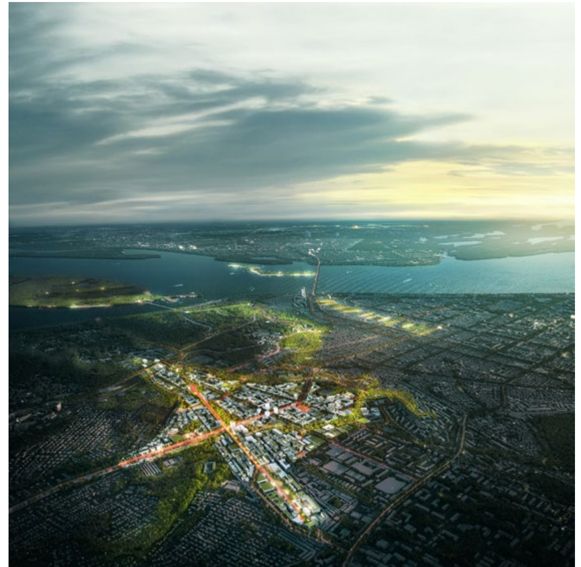
figura 2 7 Saratov Masterplan 1st Prize (c) KOSMOS x Karres and Brands x Mandaworks

El otro enfoque -que también es muy inteligente- es focalizarse, especializarse en por ejemplo, proyectos de vivienda y cuando empiezas a trabajar así, en nuestra opinión, puede ser muy eficiente y una arquitectura de alta calidad, pero tal vez si hicieras veinticinco escuelas o veinticinco planes de vivienda te volverás naturalmente conservador.