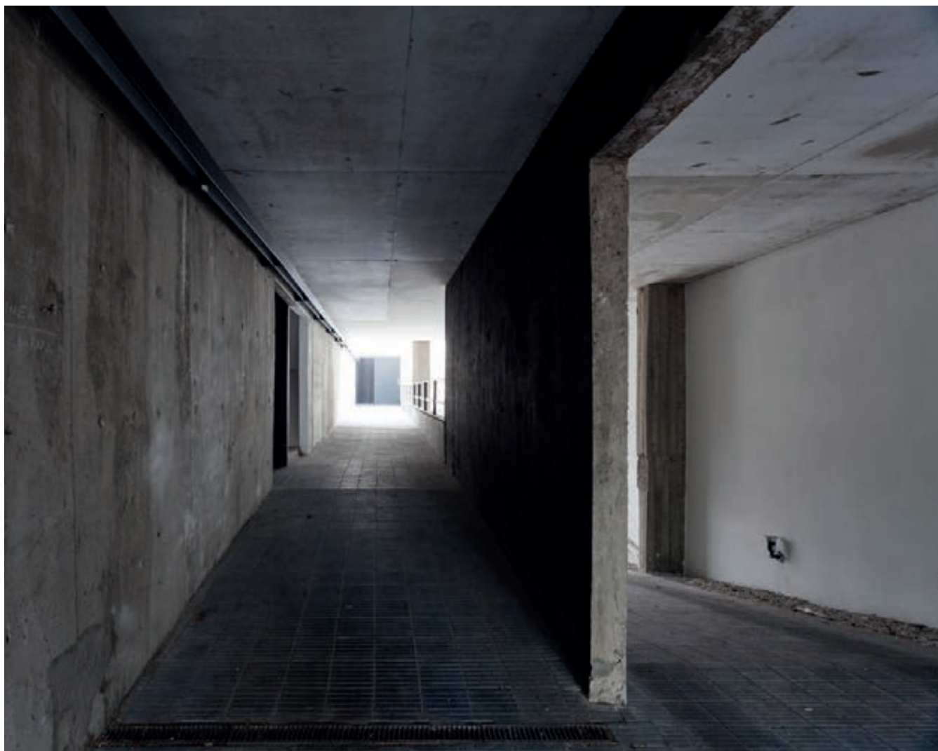
Vista desde el "túnel" de planta baja

Las viviendas Jufre son una investigación sobre las posibilidades surgidas al operar sobre las formas de habitar la ciudad al asociarse con el edificio vecino, propiedad de un amigo de confianza. En este juego de solares se demuestra que existen posibilidades originales de convivencia entre arquitecturas, a pesar de estar viviendo en un momento en el que las ciudades tienden a la densificación.