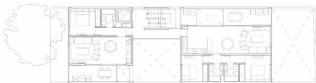
0 1 2 3 4 5 10m PLANTA TIPO