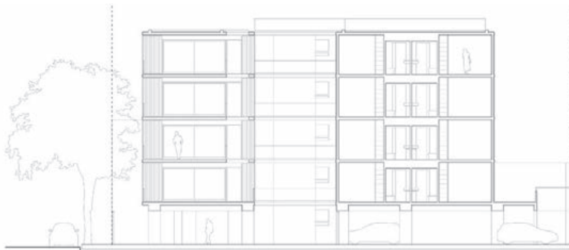
0 1 2 3 4 5 10m SECCIÓN LONGITUDINAL