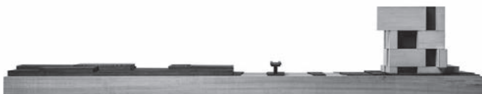
[4] Centro de Innovación Anacleto Angelini. Autor Felipe Díaz Contardo.