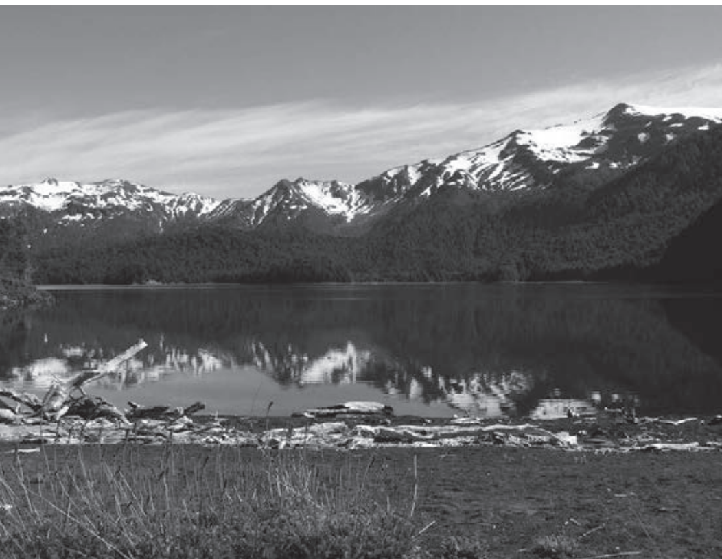
[4] Vista de las montañas nevadas tras el Lago Conguillio. Región de la Araucanía, Chile. (c) Sarah and Iain. Creative Commons License.