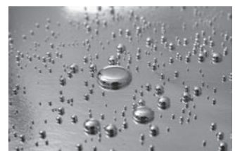
[3] Gotas de mercurio.