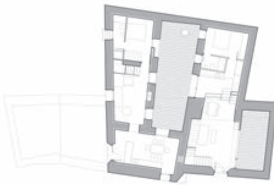
PLANTA BAJA. INTERVENCIÓN

La obra transforma los espacios interiores ocupados originalmente por tres viviendas muy compartimentadas. El interior de las viviendas carecía de huecos suficientes para la ventilación e iluminación. Las fachadas, debido a su protección patrimonial, no podían modificarse, por lo que el proyecto abre un patio –grieta en su interior– largo y estrecho, que ordena a ambos lados las dos nuevas viviendas desiguales, para dos hermanos, y las dota de luz natural y ventilación.