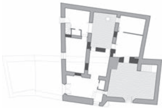
PLANTA BAJA. ESTADO ORIGINAL