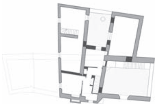
PLANTA NIVEL 1 ESTADO ORIGINAL