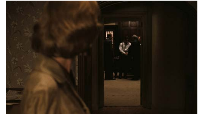
figura 5 FORD COPPOLA, F. The Godfather . Willis, G. (foto.). Paramount Pictures, 1972