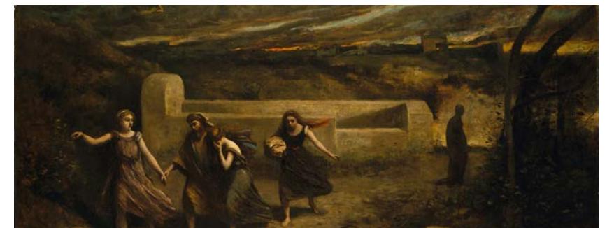
figura 12 COROT, C. The burning of Sodom, 1843-1857. Óleo sobre lienzo; The Metropolitan Museum of Art, New York