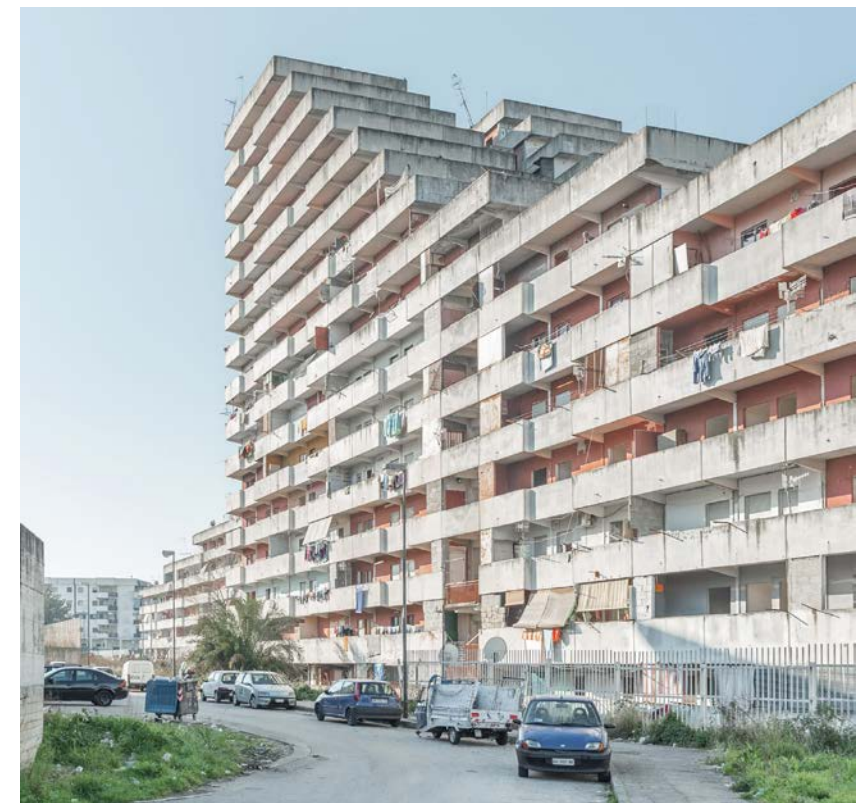
figura 8 Le Vele (Francesco di Salvo, 1975). Scampia, Napoli. DE ANGELIS, M. Divisare (16/07/2018). © Mariano De Angelis.