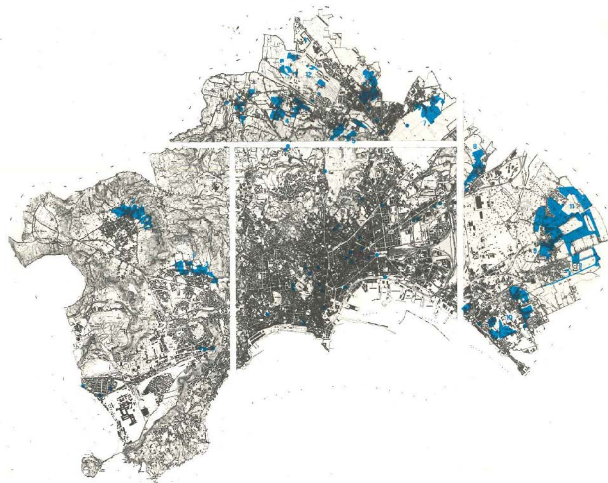
figura 1 El programa extraordinario de edificación residencial: localización de las intervenciones en el municipio de Nápoles. Casabella 487/8 (1983)

El “ programma straordinario per la ricostruzione ”, se desarrolló mediante el “ piano delle periferie ” (figura 1) que prioriza la rehabilitación y la reestructuración de los edificios degradados proponiendo simultáneamente la construcción de nuevos equipamientos colectivos y vivienda social de manera integrada al tejido urbano existente. El plan preserva los antiguos núcleos rurales que, como una constelación, rodean Nápoles y reconoce su auténtica riqueza morfológica como estructuras urbanas que funcionan, aun hoy, como polos de referencia e identificación social. El modelo pretende revertir el crecimiento descontrolado conocido como mani sulla città que sufrieron en los años 60 y 70 zonas como Secondigliano o Rione Traiano