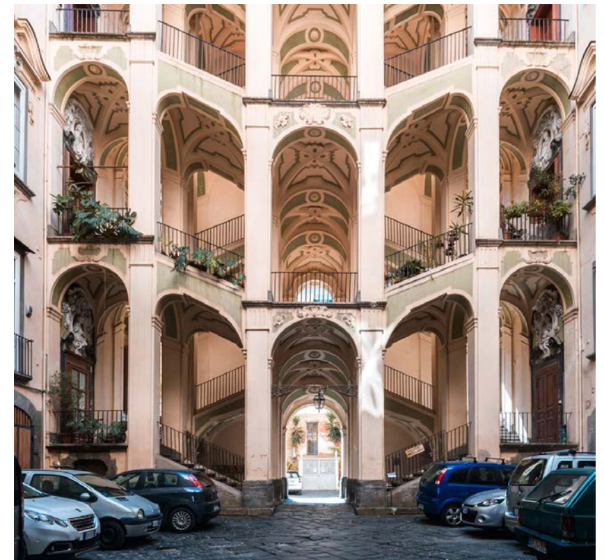
figura 7 Palazzo dello Spagnolo (Ferdinando Sanfelice, 1724-1726). Napoli. ALBANO, G. Divisare (24/02/2017).

El perfil ascendente de las Vele di Scampia nos recuerda a la cubierta de la casa que el escritor Curzio Malaparte se hizo construir en la cercana isla de Capri