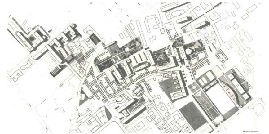
figura 3 Barra – San Giovanni. BARUCCI, P.; DE FEO, V.; D’AGOSTINO, V.; DELL’ACQUA, M.; GRECO, V.; LAMBERTI, R.; LANINI, R.; MEMOLI, C.; AVAGNINA, R.; DEZEREGA, E.; OMBUEN, S.; PERUGIA, M.P.; PIZZINATO, P.; VIGLIOTTI, C. Casabella 487/8 (1983)

distribuidos en el territorio. A pesar de que el espíritu inicial del plan era revertir la degradación asociada al crecimiento descontrolado de la ciudad durante los años 70, no sólo se mostró incapaz de reconducir la situación, sino que, ajustándose perfectamente al sistema Camorra, aceleró la tendencia fatídica de la ciudad.