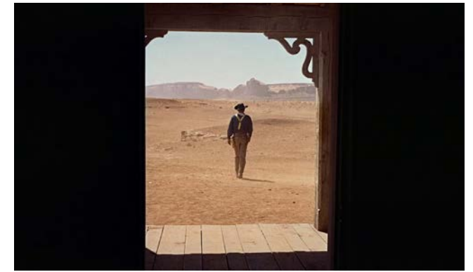
figura 4 FORD, J. The Searchers . Hoch, Winton C. (foto.). Warner Bros, 1956

Gomorra abre las puertas que Nápoles mantiene cerradas, evidenciando así la voluntad transformadora de la ficción. Nápoles es simultáneamente el modelo retratado y la materia prima que la ficción utiliza para ofrecernos una visión dramatizada de la ciudad. Mediante este proceso, algunos de los edificios más emblemáticos de la ciudad adquieren un papel simbólico en Gomorra , contribuyendo al ensamblaje de la estructura narrativa de la serie a la vez que señalan algunos de los principales problemas que adolecen la ciudad real.